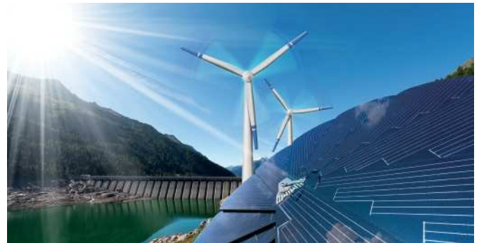
Investition in Erneuerbare Energien über Unternehmen, die Energie aus Wind, Wasser und Sonne gewinnen.

Mit einer Investition in den BVT Concentio Energie & Infrastruktur profitieren Sie doppelt: Sie agieren einerseits nachhaltig und nutzen andererseits die Renditechancen eines professionell strukturierten Portfolios.