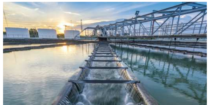
Investition in nachhaltige Infrastruktur: zum Beispiel in Unternehmen, die Technologien zur Wasser- und Abwasserreinigung anbieten.