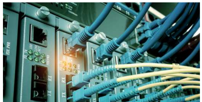
Investition in nachhaltige Infrastruktur: zum Beispiel in Unternehmen, die Glasfasernetze auf- und ausbauen.